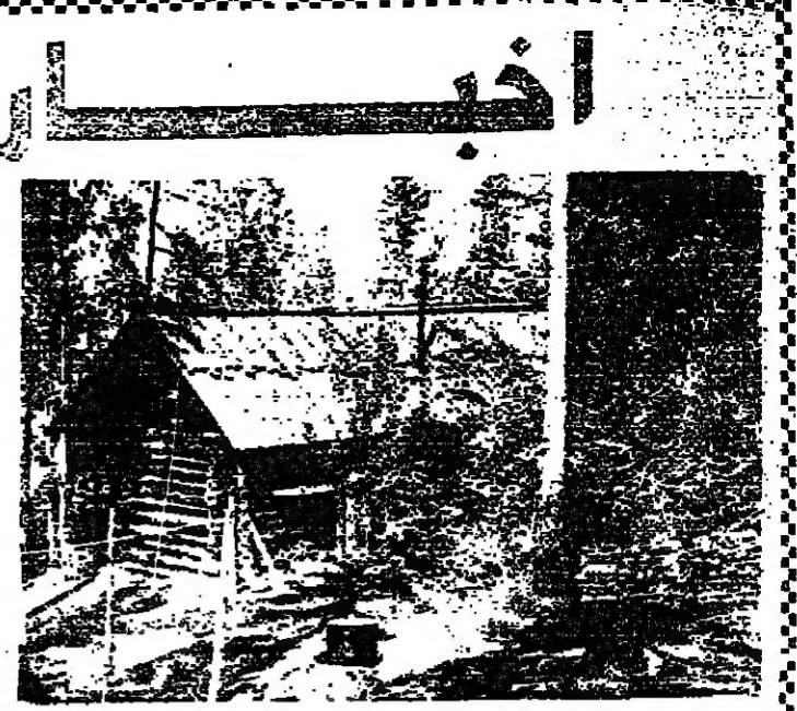
التيك الهائل الذي زلزل الارض